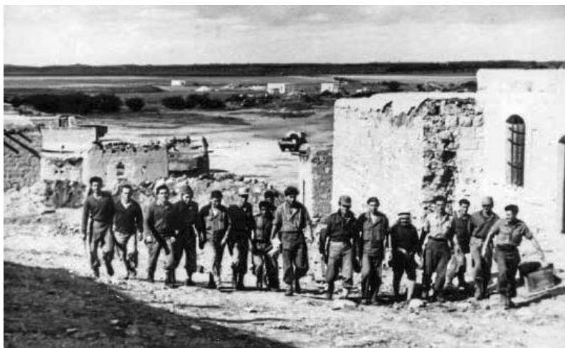
כובשי קאקון – 1948

בבוקר חזר חלק מהצבא עם המפקד שלו. הכרתי את הקצין מהבריגדה והוא סיפר כי תעלת-המגן לפני הכפר נמשכת בקו ישר ולא בקו מרוסק, כפי שהתורה הצבאית דורשת. הצבא שלנו הגיע לחפירות מן הצד ושטף את החפירות באש מקלעים.