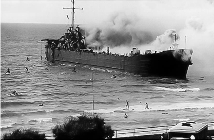
אניית הנשק של אצ"ל אלטלנה בוערת בחוף תל-אביב

האנייה היתה צריכה להגיע לחוף תכף אחר הכרזת המדינה, כאשר הכוחות האנגליים לא יתערבו יותר, ולא יעצרו אותה. היא לא יכלה להגיע לנמל חיפה או תל-אביב, שם שלטו כוחות ההגנה, ומטרתה היתה להגיע למעגן של כפר ויתקין . לפי התוכניות היו צריכות מכוניות אצ"ל מנתניה להגיע לכפר ויתקין, להעמיס את הנשק ולחלק אותו בין יחידות אצ"ל. כביש החוף לא היה קיים והנסיעה בין נתניה לכפר ויתקין התנהלה בכביש על ידנו.