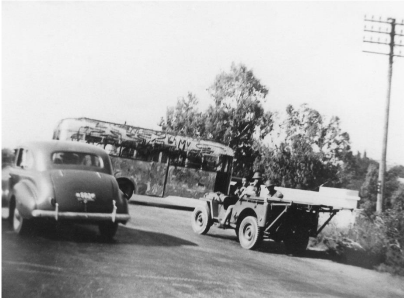
המחסום שהוצב לרוחב הכביש, ומנע תגבורת לאלטלנה

וכך נסע האוטו באין מפריע, כל יתר הנהגים עלו על המכוניות והחלו להתניע אותן. וברגע הכי קריטי בא פתרון בלתי צפוי – ממש כמו בסיפורי מתח. פלוגת ההגנה צעדה על הכביש בכיוון ויתקין ועברה בדרכה על יד השער. הקצין אמר: "לכו לישון, אנחנו נעצור את המכוניות". ובכך נגמר הכל. אני מעריך כי היינו על הכביש שעה או שעתיים. אינני יודע האם תפקידנו היה מכריע או בלתי חשוב, בכל אופן התרשמנו אז כי לשעות ספורות אלו היתה חשיבות לא קטנה. מה קרה אחר כך? האוניה הגיעה, אך לא היה למי למסור את הנשק. האנשים ירדו לחוף, נשק לא חסר להם, אך היו מעטים והם כותרו בטבעת ההגנה.