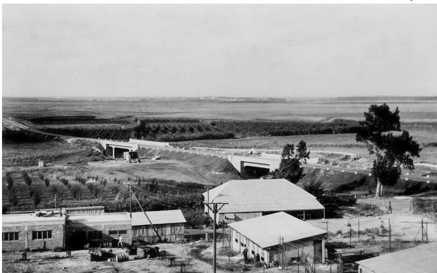
מעברות לצפון – עם סיום הסלילה של כביש מס' 4 (1938)