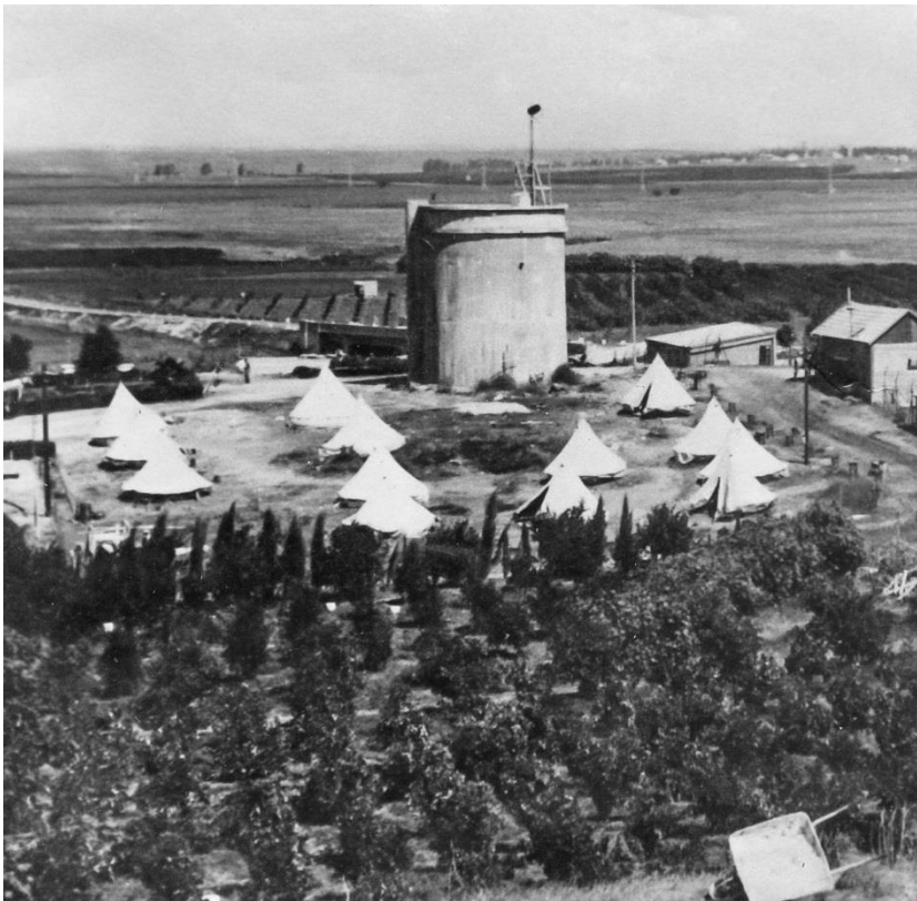
מעברות מדרום – מחנה אוהלים סביב מגדל המים

מאז עברו עוד 10 שנים. העבר התרחק עוד יותר גם במספר השנים, וגם ביחס לשינויים, שחלו בינתיים בחיינו.