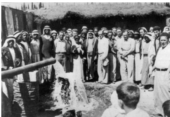
קידוח באר לערביי חוארת 1941