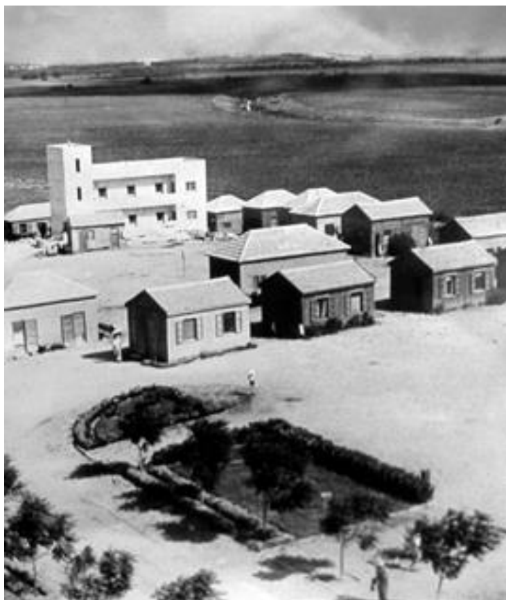
מעברות – מרכז הקיבוץ

המקום עצמו – מעברות של מלחמת השחרור – שונה לגמרי ממעברות של תקופתנו. מחנה המגורים היה קטן והתרכז כמעט כולו על הגבעה. רק 2 שורות של בניינים היו למטה. הפרדס השתרע בשטח, בו עומד היום חלק ניכר של שיכוני הוותיקים, כיתות היסוד, והרפת ועד לכביש הגיע.